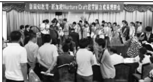
承办单位:新周知教育集团 协办单位:新加坡 Nurture Craft 教育集团

◆ 体验课内容概要: 1.现场传授快速记忆的方法并指导学生如何运用到学习当中,例如快速记忆英语单词、中文信息等。2.现场一对一辅导,短时间发现孩子惊人潜力,用事实和效果说话。3.现场传授脑力潜能开发诀窍,脑力开发专家现场接受咨询。4.免费为孩子进行脑力测验,和脑力开发专家面对面交流。 ◆ 报名程序: 1.电话预定观摩会入场券(家庭亲子套票,需家长陪同孩子一起入场) 2.于指定领票点领取观摩会入场券(仅设100个家庭席位,领票时缴50元座位押金,观摩会入场前凭票退还) 3.凭票免费参加观摩会 4.测试合格者有机会参加新周知教育在南京举办的快速记忆学习班。