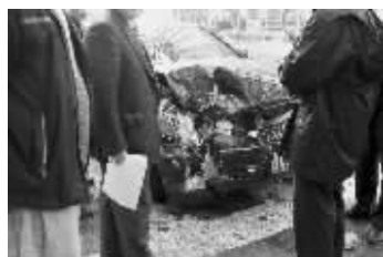
撞上旅游大巴后,轿车车头损毁严重

昨天上午9点左右,羊皮巷中山南路路口,一辆旅游大巴和一辆轿车撞上了,前者没什么损伤,后者车头右侧完全被撞烂了。事故并未造成人员伤亡。