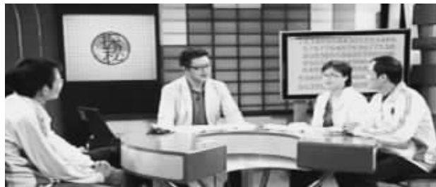
世界脑力锦标赛选手接受CCTV-10《百科探秘》专访

5月19日中央十套《百科探秘》栏目播出的《记忆大师的秘密》节目引起观众的巨大反响,几位世界记忆大师应邀到节目现场展示了他们惊人的记忆能力,当场揭开神奇记忆术的神奇面纱,他们只想通过此举告诉世人——天才是可以培养的。