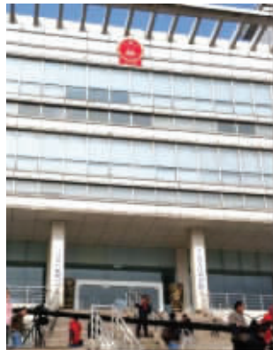
图书馆换牌 (请图片作者来领稿费)