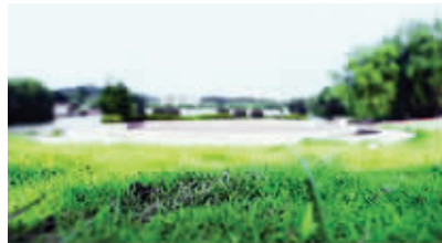
南师大情人坡 (资料图片)