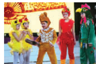
科普剧《黄鼠狼拜年》

靖江市城西小学的孩子用童话科普剧《黄鼠狼拜年》向大家介绍了一个不一样的黄鼠狼。过年了,鸡爸爸鸡妈妈正在和孩子们嬉戏,黄鼠狼来拜年了。一听说黄鼠狼,鸡爸爸就很紧张,在鸡爸爸的带领下,他们把黄鼠狼给捆了起来。黄鼠狼只好放了一个很臭的屁,把鸡爸爸一家都熏昏了过去。鸡爸爸醒来,发现全家成员一个都不少,才知道误会了黄鼠狼。他们还从森林王国那里收到一封信,上面写着黄鼠狼最爱吃的是老鼠,每年它能吃掉3000只老鼠,是真正的“灭鼠专家”。只有在老鼠吃完的情况下,它才会捕