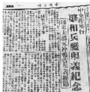
1929年《中央日报》上有关起义的报道

但到底寡不敌众,袁军炮火猛烈,并且应瑞、通济两艘军舰上的人也倒戈相向,被袁世凯派来的上海交涉员杨晟以三十万收买,两艘军舰将矛头指向了肇和舰。肇和舰上的杨虎等幸存者眼看形势不对,只好泅水而逃,幸存者都逃往蒋介石隐藏的地方,“蒋同志觉得对不起总理(孙中山),仍想到舰上去,因杨虎已回未果。”起义宣告失败。