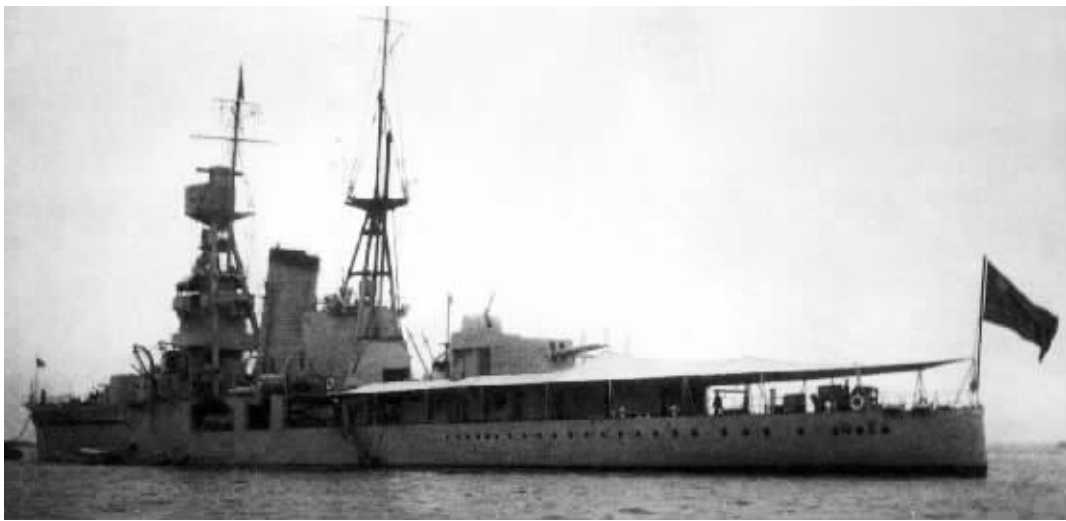
民国时期的巡洋舰 资料图片