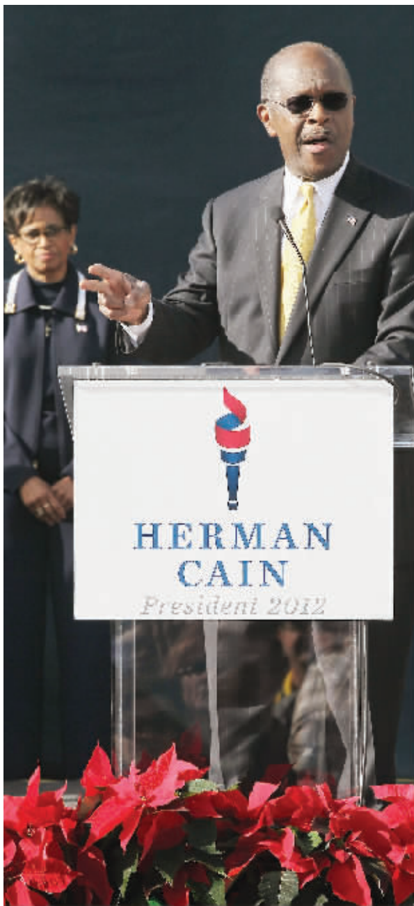
12月3日,凯恩发表讲话宣布退出总统竞选