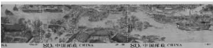
▲“清明上河图国宝大邮票”部分展示

卖会上以149万元成交,三年上涨120万倍,而“清明上河图国宝大邮票”是中国邮政一百多年来第一次破例发行的全长5米超大规格国宝邮票,全部展开相当于30多个整版