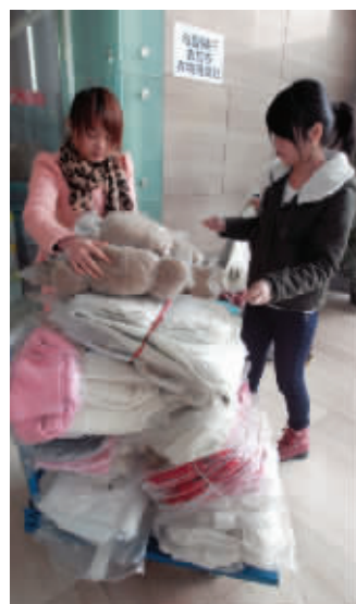
工作人员在整理爱心读者捐赠的冬衣