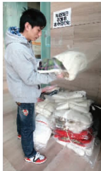
爱心读者到报社捐赠冬衣