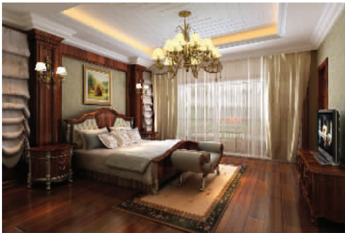
金拇指装饰设计作品

据了解,目前南京装饰公司的促销手段可谓五花八门,先装修后付款、低价促销、快装、免人工费等无不触及家装底线。针对家装公司的这些促销手段,多数装修业主不是一下子就能接受,他们已越来越理性化,不会被低价所诱惑,最终的衡量标准还是在于装饰公司的整体性价比。公司是否正规、装修费用是否能够让自己承受、设计方案是否拿人、施工水平怎样、出了问题是否能