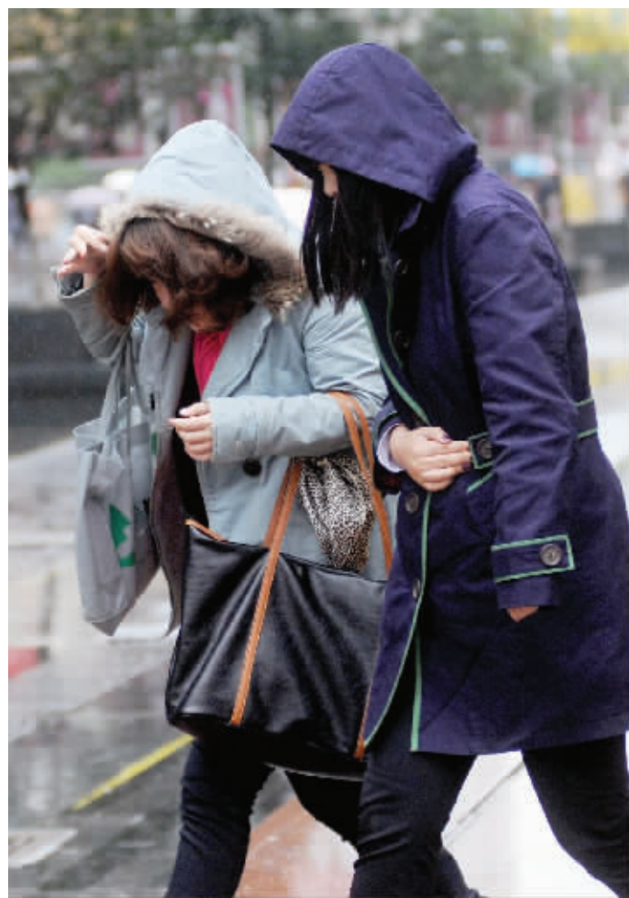
气温下降, 街头不少行人穿上了冬衣

而在400多米高的紫金山上, 由于海拔较高, 山顶上已经出现了比较明显的积雪, 有网友随手抓起雪花拍下照片, 传到微博上炫耀。