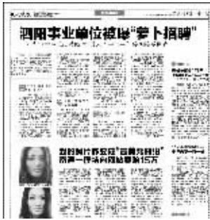
快报11月23日的报道引起关注

此前,泗阳方面已于11月21日下午及晚上两次发布公告回应。在前两次公告中,泗阳方面称,“高分四连号”事件中准考证号为1528、1525、1527号的考生作弊,取消其考试成绩,三年内不准其参加泗阳县事业单位招聘考试。负责此项工作的泗阳县人才中心主任被停职,接受调查。