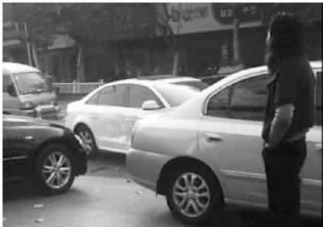
锐志正在猛撞奥迪(视频截图)

前天下午4点左右,溧阳南大街发生了一起令人侧目的事件。一辆奥迪车堵住了一辆锐志车的出行路线,锐志车司机一怒之下,竟然车头朝着奥迪车身实施了四连撞。整个过程被网友拍成视频传到网上,引来上万网友点击评论。目前,警方已介入调查,法律界人士表示,如果奥迪车受损超过5000元,那么锐志车司机有可能涉嫌犯罪。