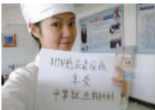
志愿者用微笑支持消除艾滋歧视

昨天上午,南京的公益机构“天下公”向人力资源和社会保障部、卫生部分别邮寄了一份特别信函,信中有志愿者们耗时两个月征集到的12621张微笑照片,每张照片的笑脸旁都有标语,呼吁社会消除对艾滋病感染者的歧视,争取平等就业机会。