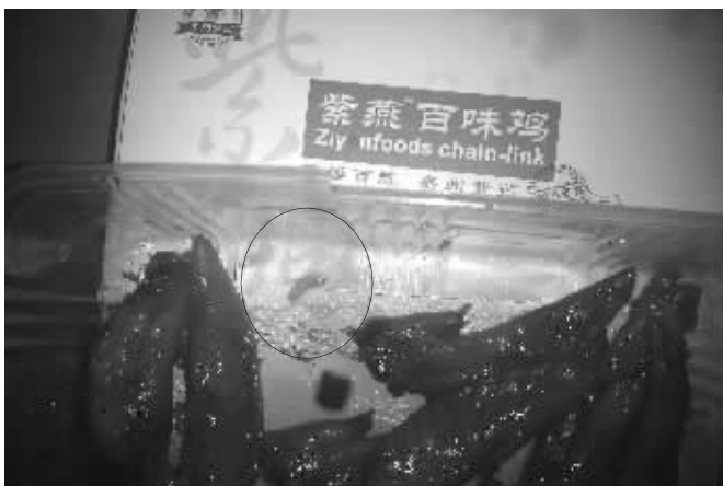
这盒辣翅中有只蛆(画圈处)

记者向店员出示了相关照片,“我们店里应该不会出现这样的情况。”该店员看了照片后说,他们的食品都是统一从加工厂运送过来的,所有食品都是当日生产的,门店每天开门关门前也都会仔细进行消毒,食品中不可能有蛆虫。快报记者 季敏