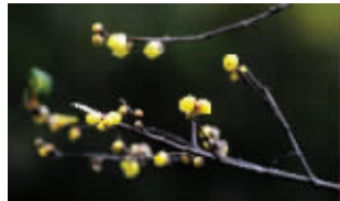
蜡梅提前开了

红枫转红的时间,比往年迟了一两个星期;原本早已落幕的桂花,这几天又零星开出“三茬桂”;冬天的蜡梅又提前一个星期开了!蜡梅香、桂花香混在一起,这到底是秋天还是冬天?就连植物专家也糊涂了。