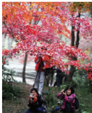
红枫引来摄影爱好者