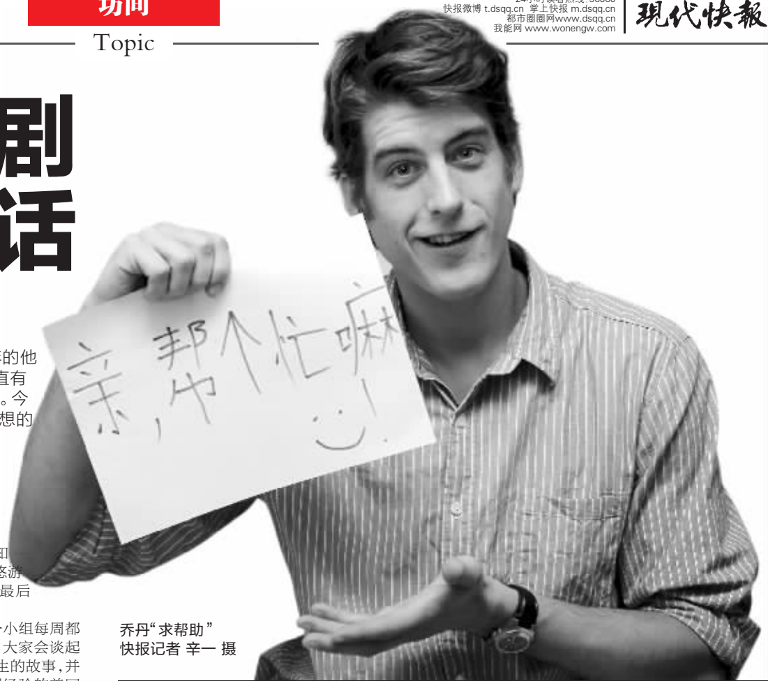
乔丹“求帮助”