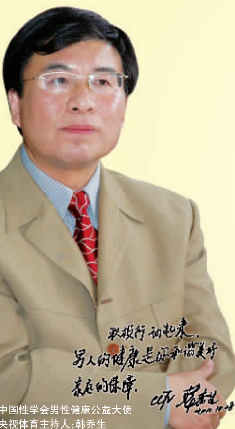
中国性学会男性健康公益大使 央视体育主持人:韩乔生