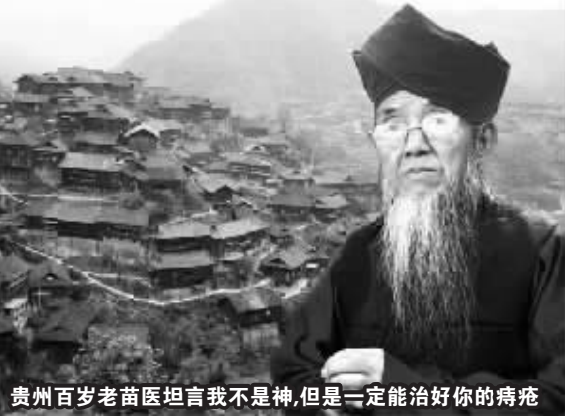
贵州百岁老苗医坦言我不是神, 但是一定能治好你的痔疮

为了让更多患者摆脱骨病折磨, 享受快乐生活, 金道山教授特批准买2盒送1盒, 3盒送3盒, 的优惠活动, 请抓紧这个省钱的机会, 活动只有5天时间。在我市虎跑路3号的汉中门大药房, 订购热线: 025-66639077, 免费送货到门。