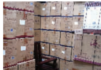
假酒堆满了一间屋