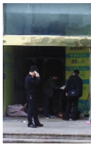
流浪汉死前一直住这个废弃的大楼里

加大了主动救助力度,工作人员每天和公安、城管在全市主要区域进行拉网式救助,积极引导街面流浪乞讨人员进站接受救助,对不愿进站接受救助的乞讨人员发放棉被、冬衣等御寒物品。”救助站工作人员表示。