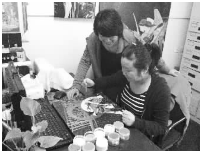
两姐妹在制作“沙金画”

经过近两年的刻苦钻研,姐妹俩终于创新出一系列的新型制作技术,不但做工速度比原来快了2倍,而且还能表现出丰富自然的画面来,可以作出有丝画面、无丝画面、亮面、哑光面、沙面、无框画等多种外观效果,特