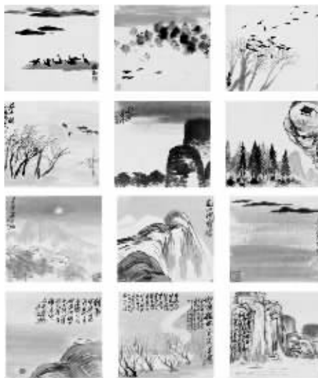
齐白石《山水册》(十二开) 1.94亿元成交