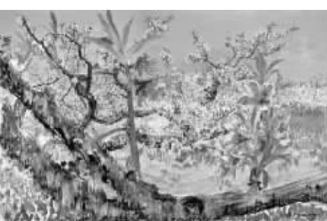
周春芽《致春天》 600万元成交