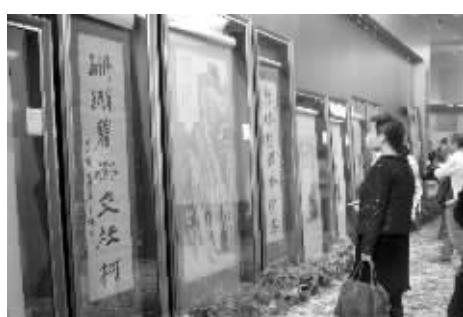
江苏九德秋拍预展现场图中作品为《奇峰观瀑布书画一堂》