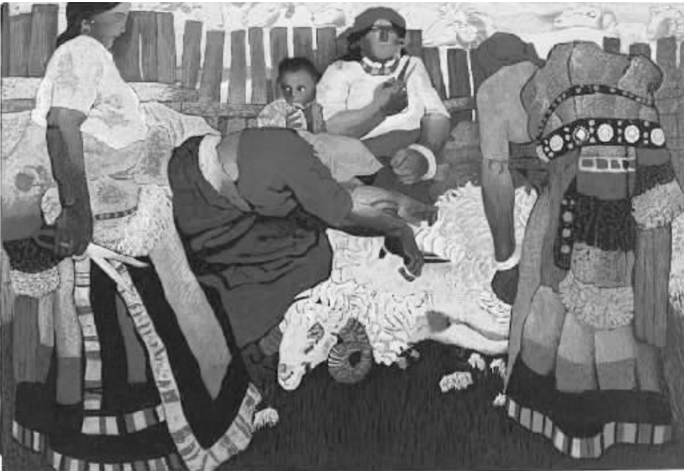
周春芽《剪羊毛》 3047.5万元成交

2010年，中国艺术品市场交易总额达到1694亿元，赶超英国成为仅次于美国的世界第二大艺术品市场。据雅昌监测中心相关资料统计，在今年上半年国内艺术品拍卖市场中，219家拍卖公司实现总成交额428.42亿元。今年春拍可谓价格飞得太远太高，而本年度秋拍开锣之时便笼罩在国际经济不景气的大环境下，加上更多人对今秋拍场“遇冷”的种种论调，有人在观望，有人在出手，一场秋拍保卫战正在进行中。