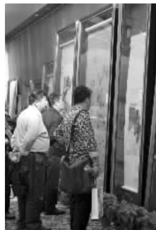
江苏九德预展现场藏家驻足观赏

美术评论家纪大年则表示：“今年秋拍仍将延续上半年走势，平稳过关。明年的走势，要看今年秋冬大盘的走向。在社会稳定为前提，经济发展为基础的情况下，中国艺术品市场仍将走高。而目前金融机构、艺术基金的介入，使得艺术品市场将‘火’下去。”对于南京地区即将上演的秋拍大戏，纪大年表示十分看好此次九德的秋拍，他说：“艺术品市场‘火’不‘火’，征集的作品质量是关键，‘真’是前提，名家精品则是‘对的’选择。”