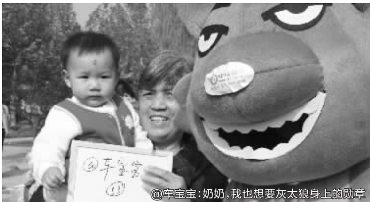
@牟宝宝:奶奶,我也想要灰太狼身上的勋章