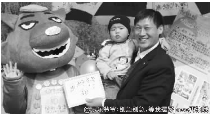
@乐乐爷爷:别急别急,等我摆好pose再拍哦

@jiangjiaqi0613:我是爱笑又爱玩的无锡博友“jiangjiaqi0613”,上个月刚过了百天。外婆带我出去玩最开心了,奶也不要吃,觉也不要睡!可一到晚上我就开始折磨爸妈,结果自己翻身居然从床上掉到地上了。本来没想哭,看到妈妈着急的样子,我决定撒撒娇干嚎了好几声,把妈妈心疼死了。外公最疼我了,看,被他抱在怀里真惬意啊!