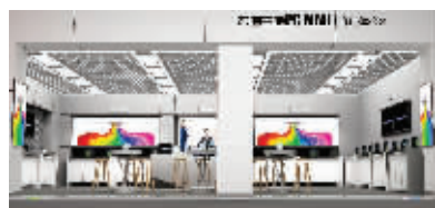
宏图三胞云体验中心