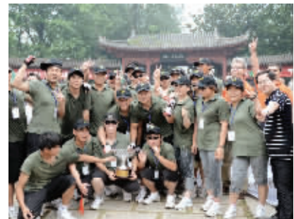
公司每年举办丰富多彩的文化生活

2001年4月,世界领先的汽车公司福特汽车公司和中国汽车的百年企业——长安汽车集团共同签约成立了长安福特汽车有限公司。2006年3月,马自达汽车公司参股长安福特,公司正式更名为长安福特马自达汽车有限公司,三方持股比例为:长安50%,福特35%,马自达15%。