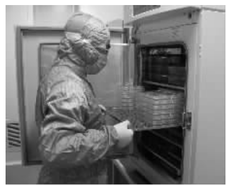
从培养箱中取细胞。

发部位不同,其治疗也不一样。任何单一的疗法都很难达到理想的治疗效果,对肿瘤务必进行系统综合的治疗。国际医学界目前最先进的治疗理念是多种手段联合运用、协同作战的整体综合疗法。