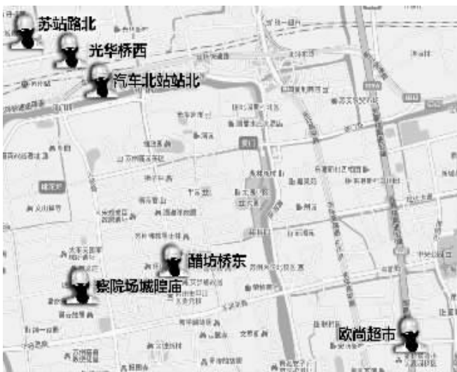
这6个地方小偷较多,但其他地方同样可能有小偷 制图 张冰洁