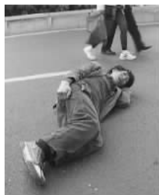
跳桥男子侧卧在地上

昨天中午,南京火车站东侧的立交桥上突然出现一名中年男子,不顾众人的好心劝阻,从七八米高的桥上跳下。