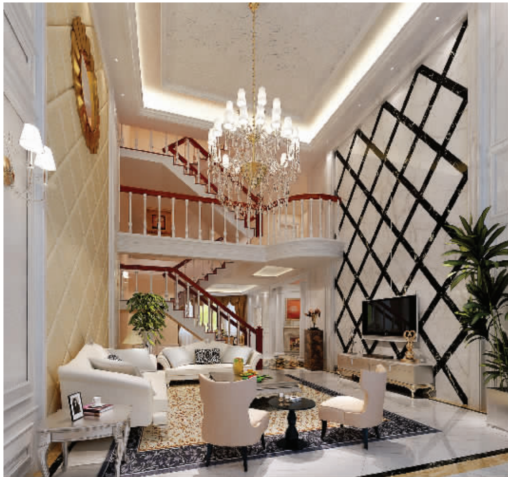
本版图为龙瑞装饰设计施工的别墅样板房

人们的生活,就是一部围绕家展开的交响曲,里面的基调是爱,旋律是情与义。纵然有再大的事业,也需要家这个强大的底座。