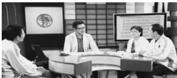
世界脑力锦标赛选手接受CCTV-10《百科探秘》专访

5月19日中央十套《百科探秘》栏目播出的《记忆大师的秘密》节目引起观众的巨大反响,几位世界记忆大师应邀到节目现场展示了他们惊人的记忆能力,当场揭开神奇记忆术的神奇面纱,他们只想通过此举告诉世人——天才是可以培养的。