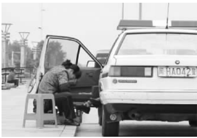
这张警车伸脚擦鞋图令网友惊讶

“里面的爷也不出来露个脸?”一辆悬挂福建省南平市牌照的警车停在浙江省衢州市路边,一只脚从警车里伸出来,一位擦鞋妇女坐在车门口,正在低头擦鞋。这一幕被网友拍下来发到微博上,24小时内被转发上万次,很多网友谴责这位警察“太大爷”。福建省南平市公安局官方微博“南平公安”对网友表示,此事已在核实。据记者了解,这辆牌照为“闽HA042警”的车,属于福建省南平市浦城县法院。