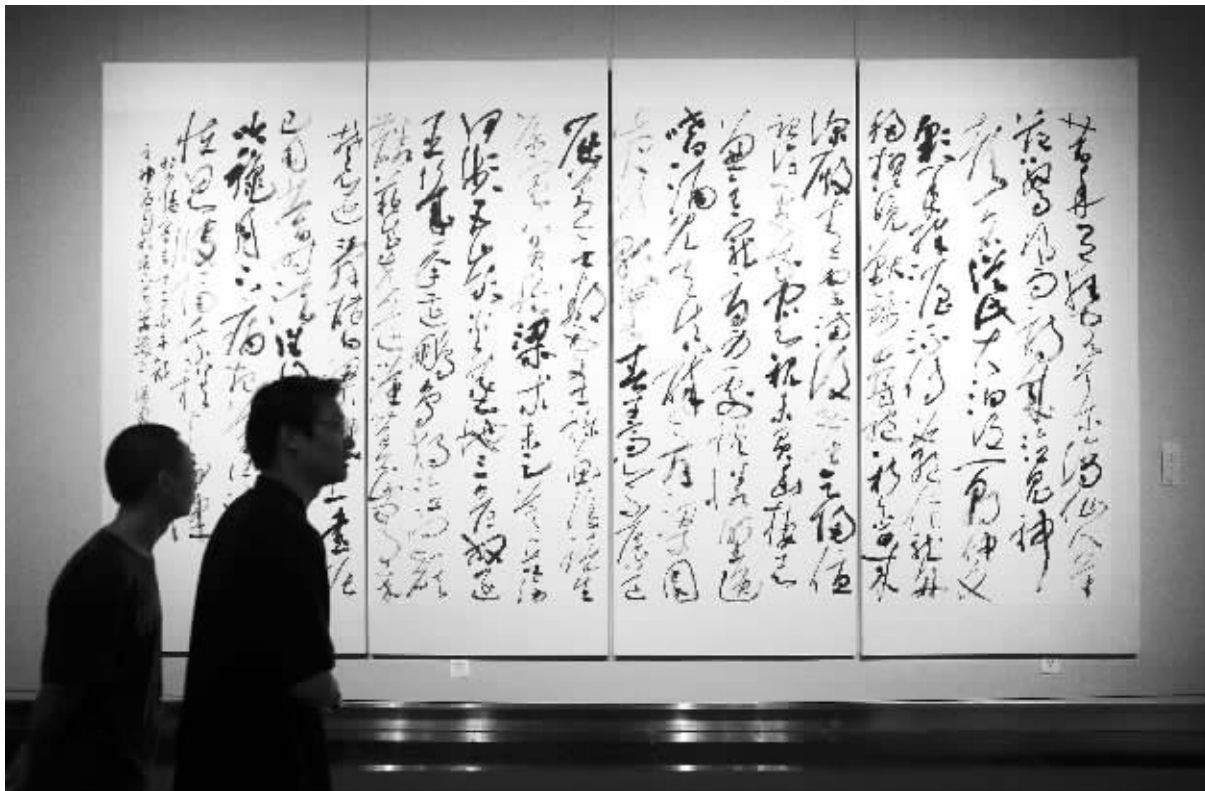
李双阳 草书 杜甫诗