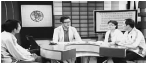
世界脑力锦标赛选手接受CCTV-10《百科探秘》专访

5月19日中央十套《百科探秘》栏目播出的《记忆大师的秘密》节目引起观众的巨大反响,几位世界记忆大师应邀到节目现场展示了他们惊人的记忆能力,当场揭开神奇记忆术的神奇面纱,他们只想通过此举告诉世人——天才是可以培养的。