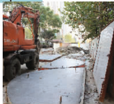
围挡内的施工现场

通恢复正常。而此时,青石街施工仍未结束,还是单行道。两个月的工期为何近3个月还没完工?为何其它地方的雨污分流工程都能按期竣工,这边不能?