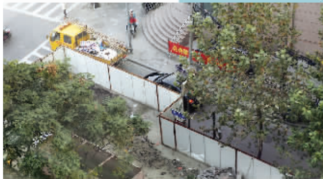
青石街与洪武北路路口围挡