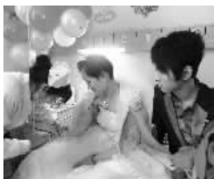
婚礼上,护士为新娘换药水