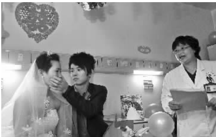
证婚时,新郎为新娘擦拭泪水