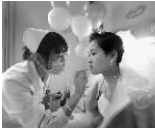
医务人员正在给新娘化妆