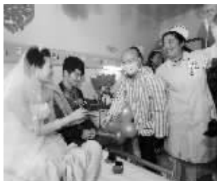
病友给新人们送上鲜花