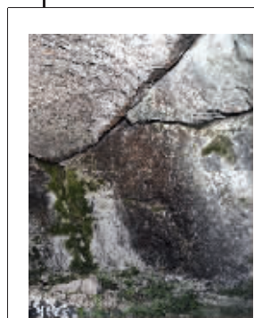
专家称洞壁有裂缝会漏雨,信徒便将佛像搬走