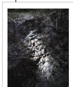
专家称,工匠可能在佛台下方刻下了姓氏