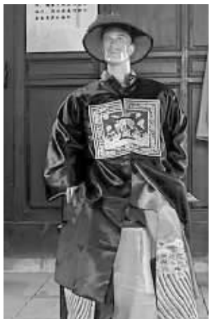
县衙里摆放的洋人模特

古代的县衙里,竟然坐了个洋县令,这难道是在上演穿越剧?6日,网友在大渝社区发帖称,重庆永川松溉古镇重建的永川县衙里,竟陈设着十多个外国塑料模特装扮的县令和衙役。这一幕,让许多网友汗颜,“太搞笑了”,实在是“丢人现眼”。8日,记者从松溉古镇了解到,他们已经决定换掉这些洋模特。