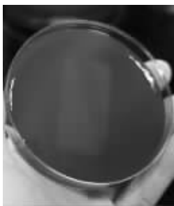
▲用湿纸巾擦过的直板手机,基本看不到细菌菌落