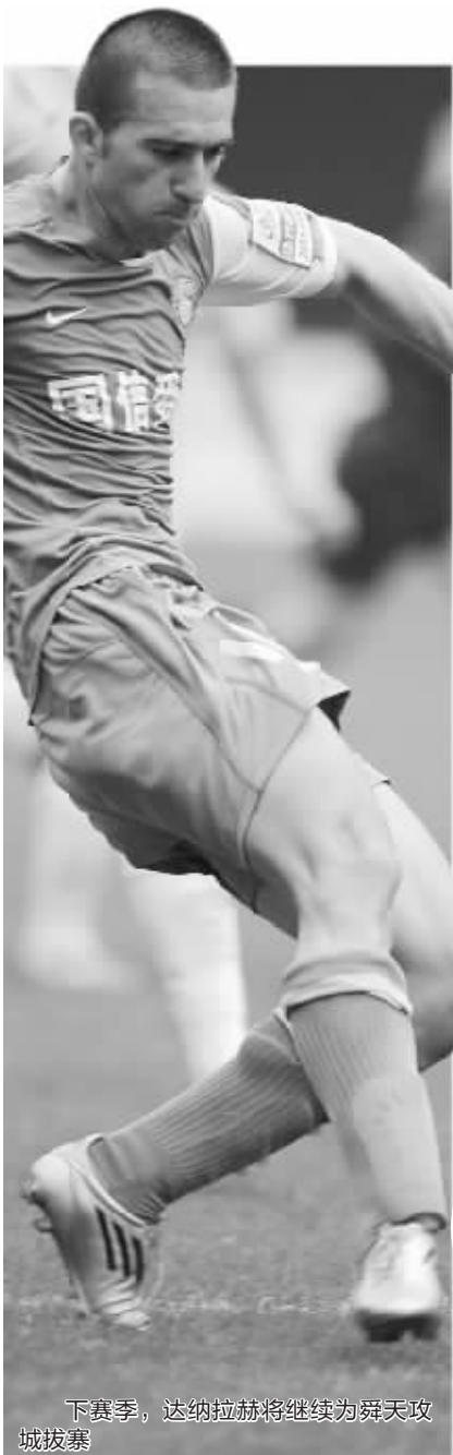
下赛季,达纳拉赫将继续为舜天攻城拔寨