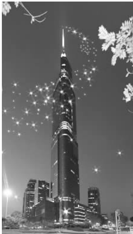
来紫峰大厦邂逅“巅峰爱情”

又逢深秋，又逢光棍节，你是否依然踽踽独行？在这百年一遇的“神棍节”里，如何过才有新意？快闪？聚餐？泡吧？还是唱K？这些统统都OUT。在这个形影相吊的节日里，结识你的TA，由奇数变为偶数。2011.11.11，加入幸福寻人启事，全城搜索属于你的“巅峰爱情”！