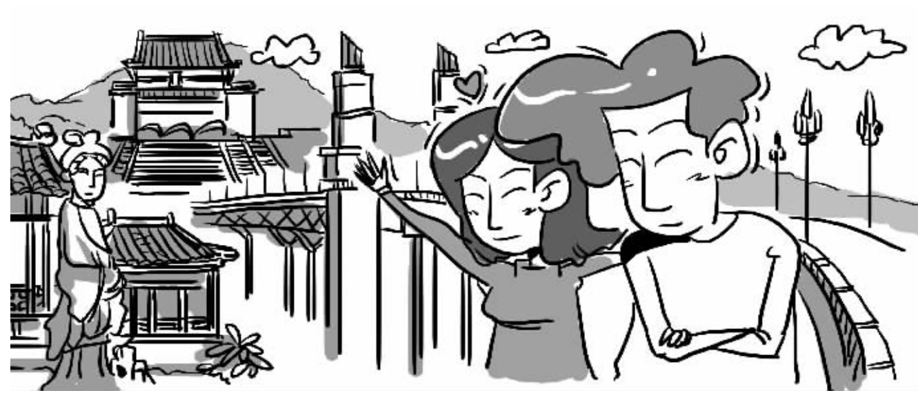
中山陵、莫愁湖、长江大桥……这些都是光棍们“脱光”的福地 本版漫画 俞晓翔

但她从没想过见面或者发展成男女朋友,“不现实吧,只有电影里才有。”所以当他说他没来过大陆,想来玩玩还邀