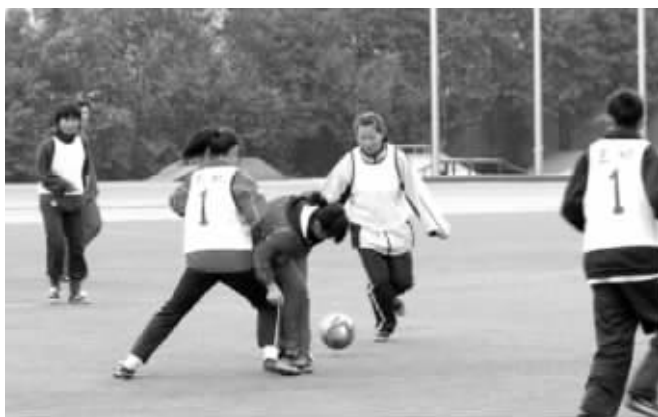
南京南湖一中校园足球搞得很红火 (资料图片)

近来,关于校园足球的各种消息接二连三,让人们对学校足球这个话题重视起来。昨天,亚足联精英教练进校园系列活动在南京市南湖一中进行,前国家队女足名将高红现身活动现场,亲自给南湖一中的足球小将们授课,活动现场气氛热烈。事实上,这段时间,校园足球已经在全国范围内开展起来,南京更是热闹非凡。热闹是热闹了,但刚刚上路的校园足球其实还缺乏门道,若想真正对未来的中国足球有所帮助,还需要解决诸多实际问题。