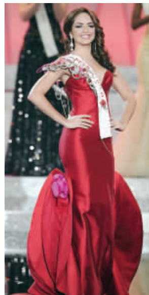
季军波多黎各小姐