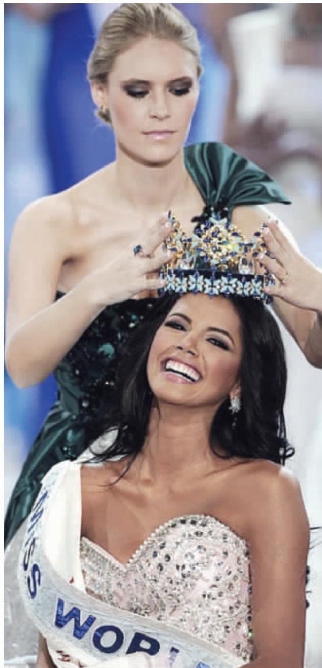
上届世界小姐比赛冠军为萨尔科斯基戴上桂冠