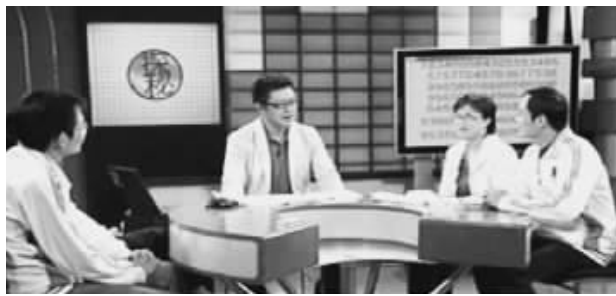
世界脑力锦标赛选手接受CCTV-10《百科探秘》专访

5月19日中央十套《百科探秘》栏目播出的《记忆大师的秘密》节目引起观众的巨大反响,几位世界记忆大师应邀到节目现场展示了他们惊人的记忆能力,当场揭开神奇记忆术的神奇面纱,他们只想通过此举告诉世人——天才是可以培养的。