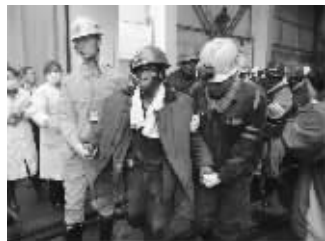
11月5日晨,获救矿工正在升井

5日下午,义煤集团召开新闻发布会,表示将按照国家相关规定对遇难矿工进行赔偿,最低金额不会低于40万元。义煤集团董事长武予鲁表示,对于事故中受伤矿工,集团公司将根据国家规定,按照省委省政府主要领导要求,全力以赴给予最好的医疗救治,不能再因治疗失误而让他们致残。武予鲁还确认造成此次事故的原因系地震。 综合