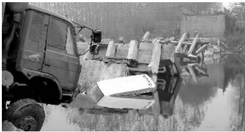
水新公路沱河桥坍塌事故现场

河南省项城市水新公路的沱河板桥5日5时许发生坍塌事故,造成一辆满载沙子的重型卡车和一辆微型面包车落水,一辆出租车和一辆中型货车坠落桥下,两人轻微伤,伤者是微型面包车司机和中型货车司机。