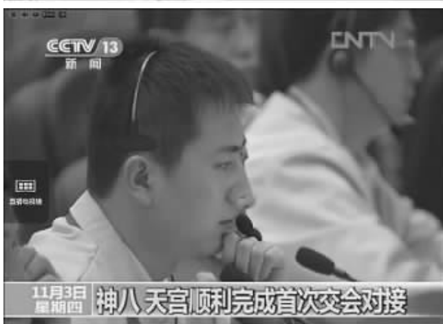
“天宫神八哥”在北京飞控指挥中心(央视视频截图)