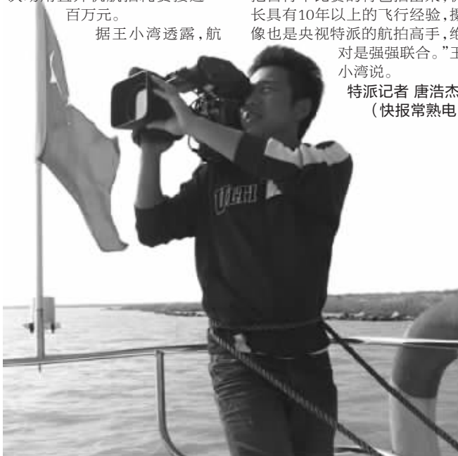
为了水上拍摄,摄影师绑上麻绳