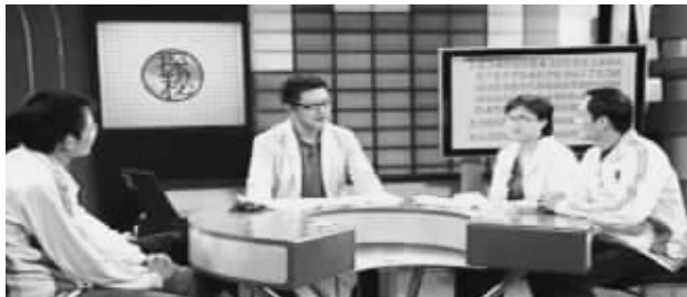
世界脑力锦标赛选手接受CCTV-10《百科探秘》专访

5月19日中央十套《百科探秘》栏目播出的《记忆大师的秘密》节目引起观众的巨大反响,几位世界记忆大师应邀到节目现场展示了他们惊人的记忆能力,当场揭开神奇记忆术的神奇面纱,他们只想通过此举告诉世人——天才是可以培养的。