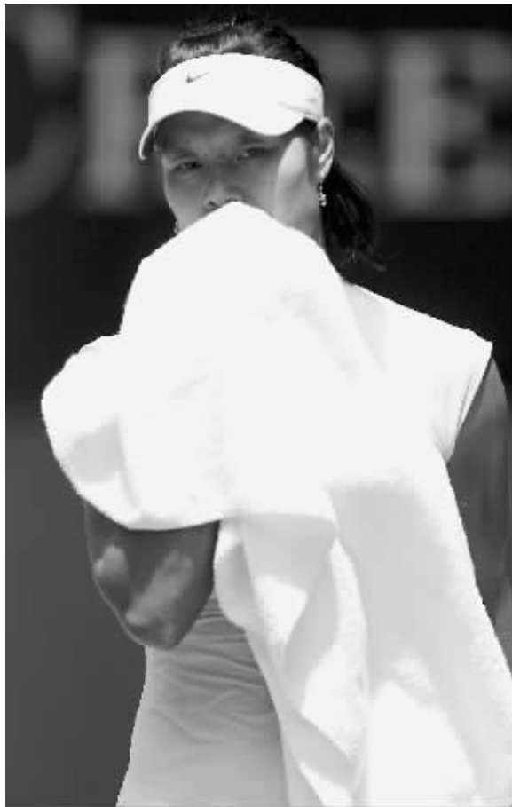
李娜:秀美甲难道也不行?

热闹归热闹,不少名人的微博还是惹来了不少的麻烦,比如李娜,比如丁锦辉等等。总结起来就是一句话——都是微博惹的“祸”。