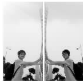
网友恶搞的对称照片