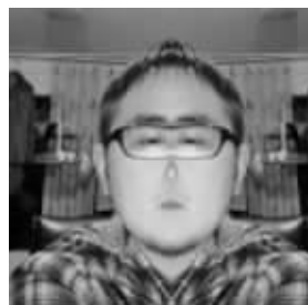
网友微博上的大头照对称脸

回文对联也不胜枚举,“风清月朗感花香才隽,水碧山远寓道体禅宗。宗禅体道寓远山碧水,隽才花香感朗月清风”。有趣的是,英文也有回文修辞手法,最著名的一个回文,是拿破仑被流放到Elba岛时说的一句话:Able was I ere I saw Elba(在我看到Elba岛之前,我曾所向无敌),这句话不论从左向右看,还是从右向左看,内容都一样。