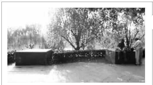
桥基已打好,桥梁一直没建起来