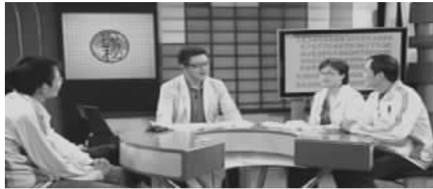
世界脑力锦标赛选手接受CCTV-10《百科探秘》专访

5月19日中央十套《百科探秘》栏目播出的《记忆大师的秘密》节目引起观众的巨大反响,几位世界记忆大师应邀到节目现场展示了他们惊人的记忆能力,当场揭开神奇记忆术的神奇面纱,他们只想通过此次告诉世人——天才是可以培养的。