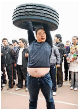
大力士 貌似空心轮胎也不是很重嘛……11月1日摄于企业内部运动会。