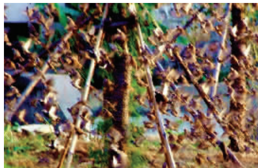
叽叽喳喳 下关回龙桥路边的花园里,每天都会飞来一群小麻雀,时而在空中盘旋,时而落到草坪上,叽叽喳喳,奏响了一支大自然交响曲。 (作者武先生获30元话费)