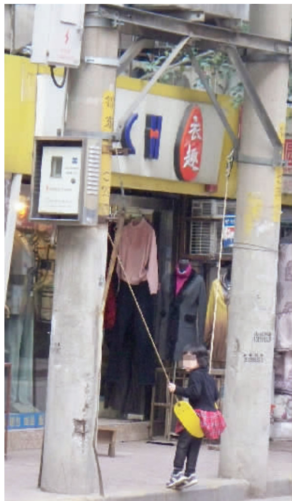
让孩子在变压器下荡秋千,亏家长想得出来,出了事可不是闹着玩的! 11月1日摄于王府园。 (作者“思成公主”获30元话费)