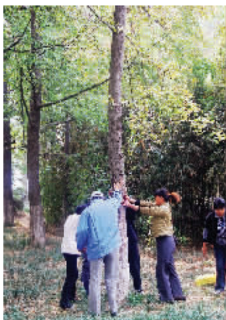
摇白果 几个人围着大树摇来摇去,干啥呢?原来是想把树上的白果摇下来……10月23日摄于玄武湖。