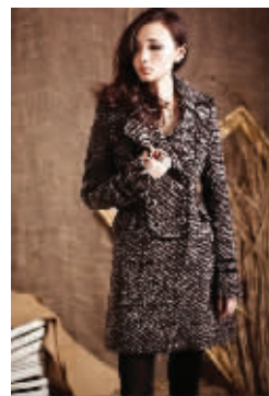
“慈善衣橱”大衣 淘宝价:120元