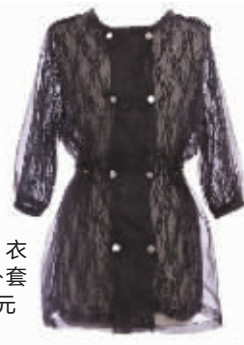
“慈善衣橱”蕾丝外套 淘宝价:80元

注:您可以在新浪微博搜索“悦美社群”,加关注,或拨打《时尚周刊》编辑部电话84783580,了解活动详细情况。