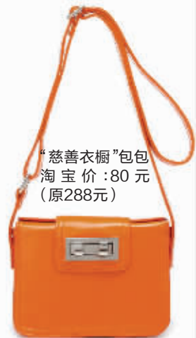
“慈善衣橱”包包 淘宝价:80元 (原288元)