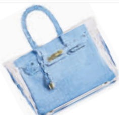
“慈善衣橱”包包 淘宝价:30元(原178元)