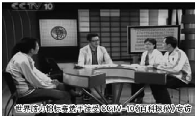
世界脑力锦标赛选手接受 CCTV-10《百科探秘》专访

■研究证明:通过训练的大脑,两天可记住1000个英语单词 ■家长可拨打电话 025-66920296 84710505 免费订票,与世界级记忆大师进行面对面交流