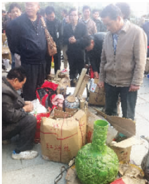
好家伙,扁担哥(蹲着的那位)挑来好多宝贝