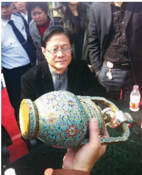
就是这件赝品花了30多万